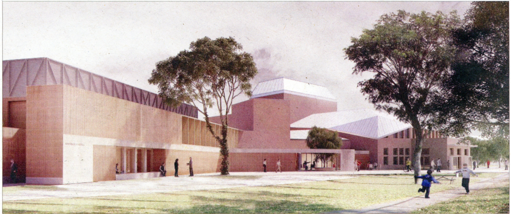
A dalt, imatge de la façana exterior de l'Auditori on es pot observar a l'esquerra la nova construcció, annexa a l'actual. A sota, imatge de l'interior de la sala on s'observa la disposició de la sala amb grades retràctils.

L'Ajuntament de Tortosa ha encarregat la redacció del projecte constructiu per a l'ampliació de l'Auditori Felip Pedrell a l'estudi badaloní FEM Arquitectura, guanyador del concurs d'idees convocat per a escollir el projecte a executar. La proposta de FEM Arquitectura passa per ampliar l'Auditori amb una nova construcció lateral, mantenint el protagonisme de l'edifici actual i també de la seua façana. La nova sala, que portarà el nom de Ricard Salvat, es construirà a l'esquerra de l'actual sala menuda de l'Auditori, en l'espai delimitat entre l'actual edifici i els carrers Rosa Maria Molas, passeig Joan Moreira i Lamote de Grignon. Des del vestíbul de l'Auditori es construirà un braç cap a l'esquerra per a donar accés al nou espai que tindrà 700 metres quadrats i acollirà, a més de la tercera sala, un espai de bar cafeteria, que servirà de nexa d'unió entre la part nova i l'antiga. També es preveu obrir un nou accés al teatre, així com un nou accés tècnic i de serveis des del carrer Rosa Maria Mo-