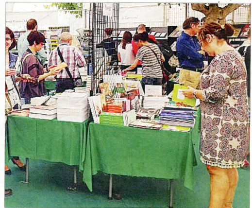
La fira del llibre ebrenc aplega uns 2.000 llibres d'autors o temàtica ebrenca.

Litterarum s'organitza la Fira del Llibre ebrenc, que aplega a la plaça de Dalt de Móra d'Ebre més de 2.000 títols d'escriptors ebrenca o relacionats amb les Terres de l'Ebre. Com és habitual, el recinte acull les presentacions de les novetats literàries més destacades de l'any. "És la mare del Litterarum i ens permet arribar a molt de públic i posar en valor la literatura ebrenca, i oferir tant autors clàssics, com les novetats",