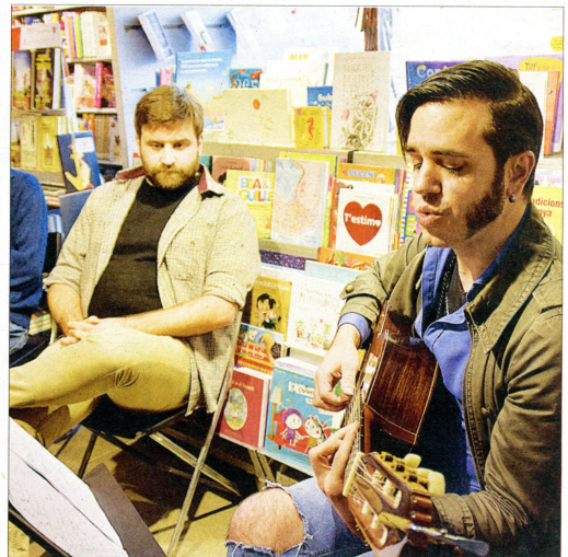
El grup Obeses participa en les residències artístiques.