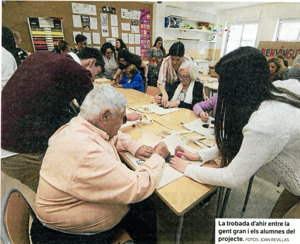
La trobada d'ahir entre la gent gran i els alumnes del projecte.

Educació. L'Institut Montsià i els Serveis Socials d'Amposta han dut a terme, amb molt d'èxit, la segona edició del 'Bon dia com estem?'