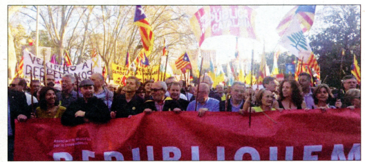
Terres de l'Ebre Redacció

Milers de persones -entre 18.000, segons la policia, i 120.000, segons els organitzadors- es van manifestar el 16 de març pel centre de Madrid a favor del dret a l'autodeterminació i per la llibertat dels presos, amb el lema “l'autodeterminació no és delictiu”