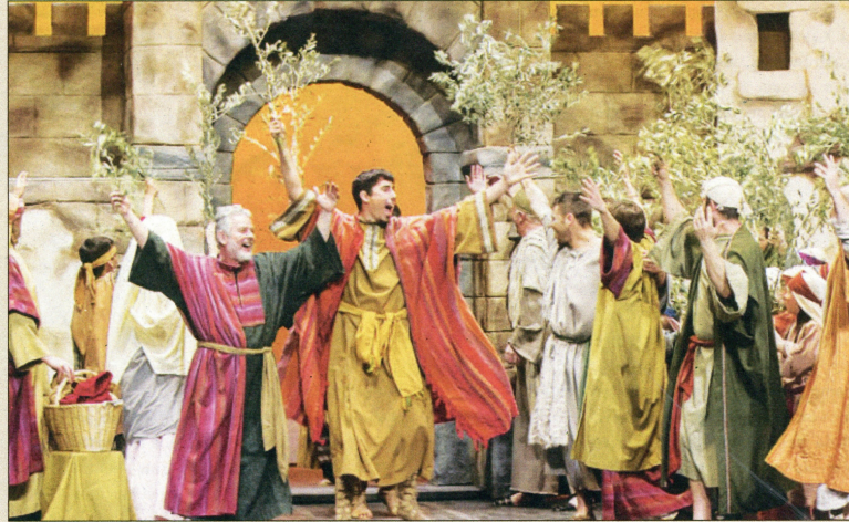
La Passió d'Ulldecona complix enguany 65 anys de representacions ininterrompudes. En el muntatge hi participen 180 persones entre actors i personal tècnic.

"Llevat del repartiment, ho hem canviat tot. En un any hem incorpo-