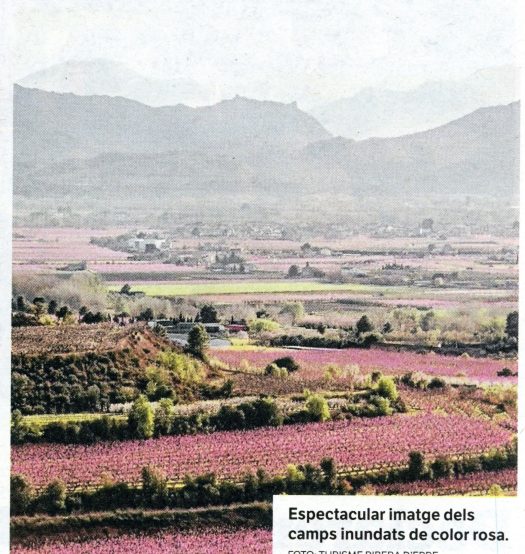
Espectacular imatge dels camps inundats de color rosa.