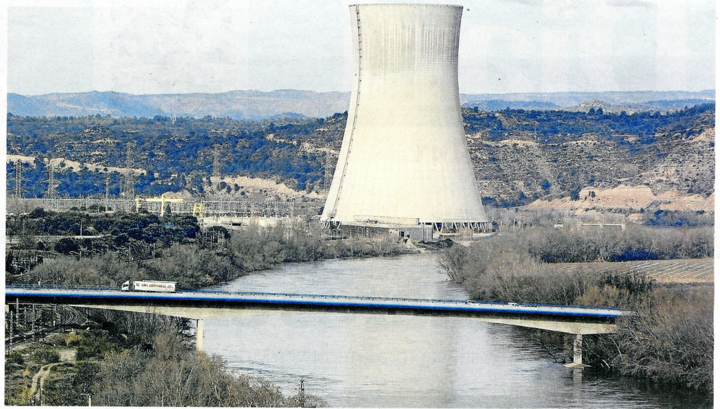
Imagen de la central nuclear de Ascó, que será de las primeras de España en ser clausurada, junto con las de Almaraz I y II, en Cáceres.