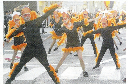
Una de les 27 comparses, ahir a Deltebre.

Amb aquestes xifres de participació (27 comparses i 1.200 persones a la Rua) podem afirmar el Carnaval de Deltebre s'està convertint amb el Carnaval de Delta de l'Ebre. De fet, enguany també