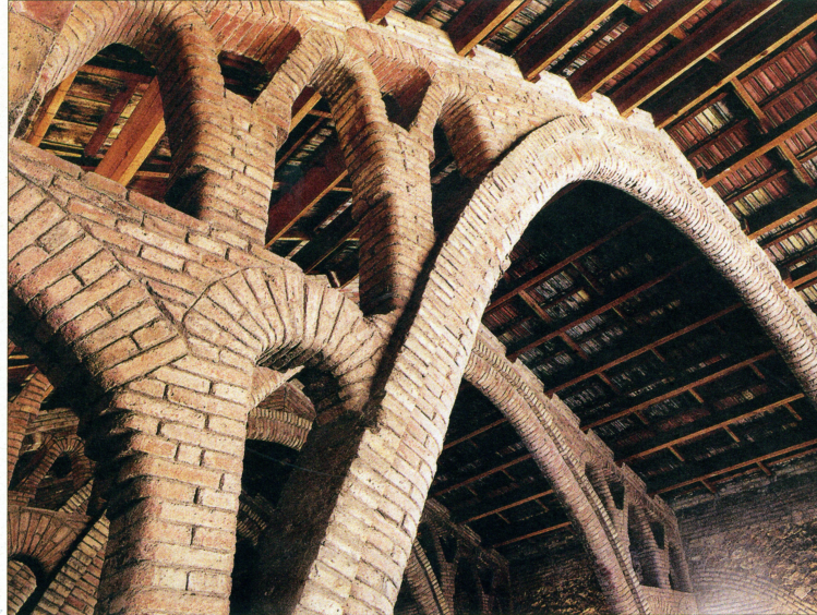
Un detall de la volta de la cúpula del Celler Cooperatiu (a l'esquerra) i dos detalls del fris ceràmic que hi ha a la façana de l'edifici (dreta).

Molts dels habitants del Pinell van decidir marxar a treballar a la ciutat i iniciar-se en el món tèxtil, però d'altres van quedar-se al poble amb la voluntat de fer reviure el que havien perdut. Els pagesos van adonar-se que l'única manera de tirar endavant era treballant junts: aglutinar la producció i els serveis associats, des de les compres fins