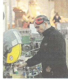
Trabajador de Bustper.