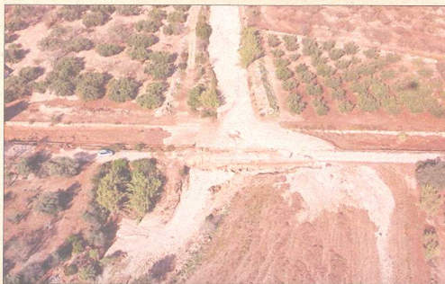
Imatge aèria, publicada pels Bombers, del barranc dels Clots, al Godall, enfangat després de la tempesta.

El telèfon d'Emergències 112 va rebre vora 330 trucades entre el Baix Ebre i el Montsià, 117 només d'Alcanar, i això que hi van caure les telecomunicacions durant una estona, extrem que encara s'investiga.