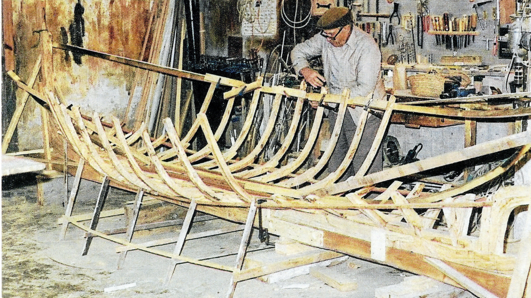
El mestre d'aixa Isaïes Vilàs collant amb serjants la cinta, per a ser clavada a les quadernes i contrarodes.

Reportatge. Isaïes Vilàs, de les conegudes com a drassanes de Solapa, va construir la darrera muleta documentada a la ciutat per al seu fill Fernando, que la guarda a casa