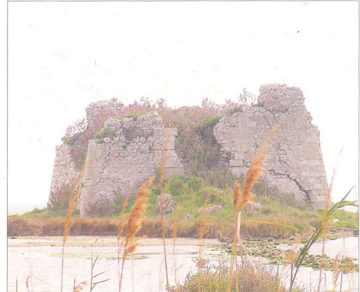
Imatge de la torre Sant Joan.

l'Ajuntament d'Amposta podrà encarregar ja el projecte constructiu per tirar endavant esta intervenció que tindrà un cost aproximat de 250.000 euros. L'Ajuntament treballarà ara per aconseguir subvencions per a finançar el projecte. “El dia que esta torre estiga consolidada i siga accessible i visitable, tindrem un actiu més turístic, pa-