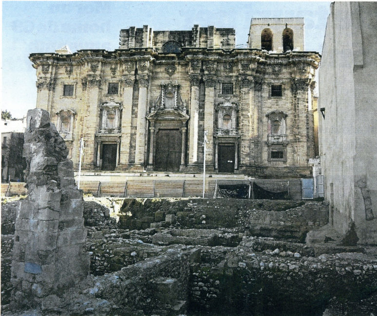
Estat actual de les restes arqueològiques davant la catedral de Santa Maria.