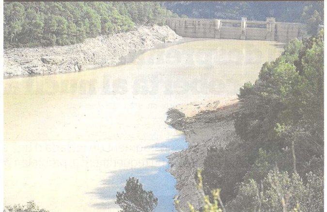
Estat actual de l'embassament, després de la llevantada.