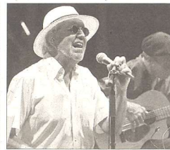
CONCERT D'ELS QICOS Els Qicos