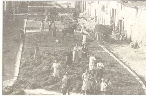
La introducció del cultiu de l'arròs al delta de l'Ebre va ser un dels principals motors de canvi de la població de la Ràpita.

blanc o amb els estampats ratllats o de quadres. "Esta brusa era molt llarga, perquè també els servia per a dormir. Es treien la roba, inclosos els calçotets, i el feien servir de camisa de dormir", explica Cartes. La roba interior, que feien servir abans no té res a veure amb els bòxers o esllips que es coneixen avui dia, sinó que eren una espècie de pantalons fins als genolls i estaven fets d'un material fàcil de rentar. Segons determina Cartes, "per sobre d'estos calçotets, els pagesos portaven uns pantalons que s'estreien a l'alçada del genoll i que s'embotonaven amb gafets al baix ventre, on es trobaven les dues peces de roba en forma d'ala, a les quals s'afegia una mena de tapa anomenada davantal, que es botonava als laterals". Per sobre es posaven una faixa, que el servia tant per a subjectar l'esquena com per a evitar lesions. "A més, esta faixa també la feien servir com una espècie de butxaques", manifesta l'historiador rapitenc. Per sobre de tot això, els pagesos vestien una armilla o una jaqueta curta anomenada jopet, per dalt de la cintura de