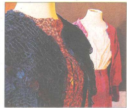
CONCURS DE VESTITS TRADICIONALS I D'ÈPOCA

Els Qicos seran els encarregats de posar punt i final als Orígens 2018 i ho faran amb un espectacle ple de sorpreses, ja que oferiran un tast del pròxim espectacle que interpretaran durant el 2019, així com musicaran cançons tradicionals recopilades per a l'ocasió. Lloc i hora: Escenari principal, diumenge a les 20 h.