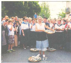
SUBHASTA DEL PEIX Diverses entitats

El pailebot Santa Eulàlia, un vaixell centenari i de quasi 50 m d'eslora estarà atracat durant els dies d'Orígens al moll comercial de la Ràpita. Es podrà visitar durant tot el cap de setmana i el dissabte a les 19 hores acollirà l'espectacle Terra de Salines de Pili Cugat i Carlos Lupprian. Lloc i hora: Moll comercial, tot el cap de setmana.