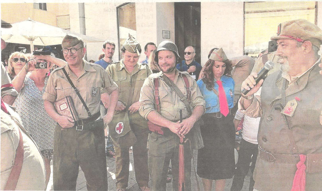
Coincidint amb el congrés, ahir a la plaça del mercat de Tortosa es va poder veure la recreació d'un hospital de sang de l'època.

L'esdeveniment reuneix més d'un centenar de participants en el 80è aniversari del conflicte