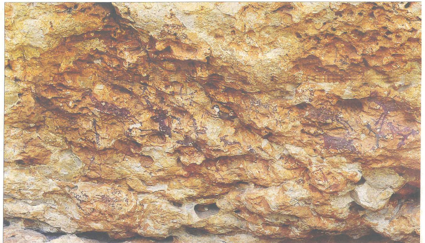
A la imatge, les pintures de l'abric I d'Ulldecona, considerada una de les escenes de caça més importants de Catalunya i on hi ha part del conjunt rupestre de la serra de Godall amb un total de 13 abrics localitzats entre Ulldecona i Freginals.

Per l'alcaldeessa d'Ulldecona, Núria Ventura, l'obertura del centre d'interpretació l'any 2006 va suposar "un abans i un després" en la gestió i posada en valor dels abrics de l'ermita