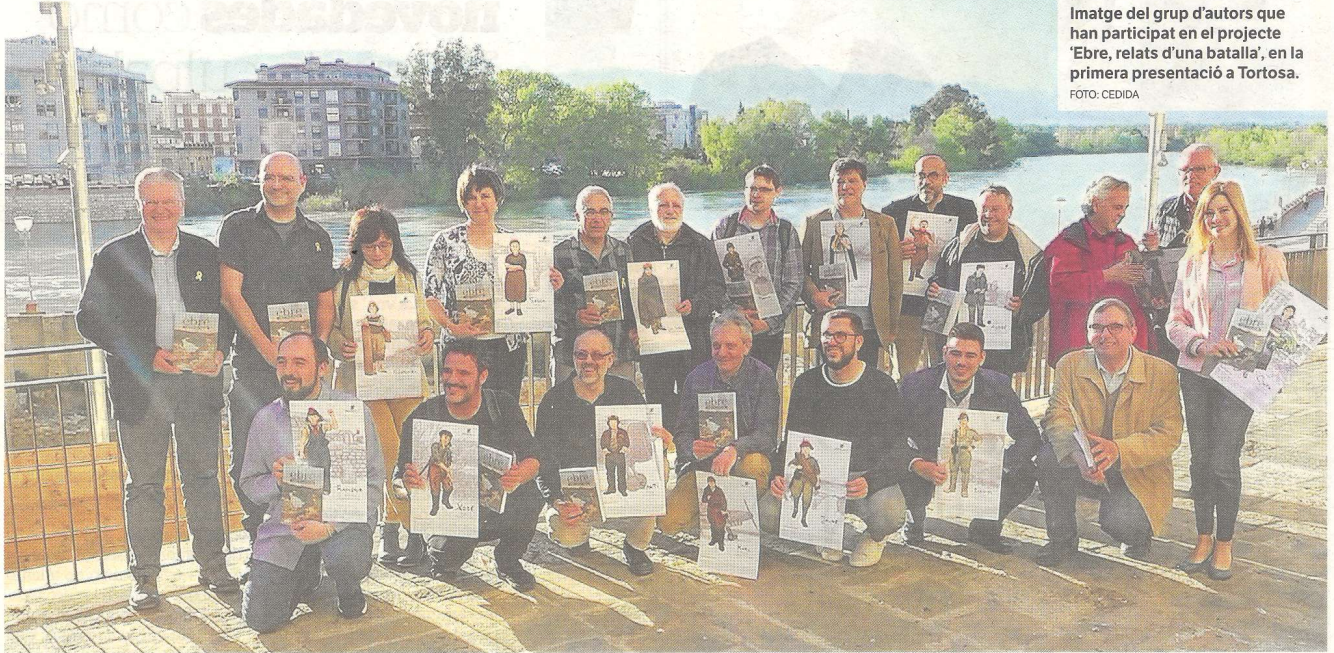
Imatge del grup d'autors que han participat en el projecte 'Ebre, relats d'una batalla', en la primera presentació a Tortosa.

Reportatge. Setze personatges, setze relats i un llibre col·lectiu sense precedents. Així és 'Ebre, relats d'una batalla', que va nàixer per acompanyar un futur joc de taula