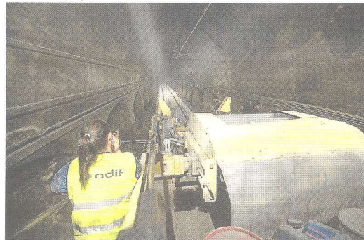
imatge de l'interior d'un dels túnels que es troben actualment en obres per millorar el seu estat.

ER15 és una de les línies que acumula més incidències i algunes queixes a la xarxa ferroviària. Tot i això, des d'Adif apunten que s'està fent una gran inversió i esforç per millorar i mantenir en bon estat el servei.