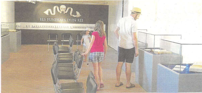
Imatge de l'exposició organitzada per l'Arxiu Comarcal del Baix Ebre.

Reportatge. L'exposició, realitzada en el marc de la Festa del Renaixement, mostra el protocol que es duia a terme durant el segle XVI davant la defunció d'un monarca