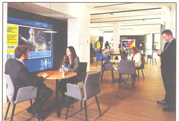
Imatge exterior i interior de l'oficina actual, a la plaça Alfons XII. Va obrir en un edifici nou en esta ubicació l'any 1973.

segmentat en els darrers anys els seus negocis per tal d'oferir un servei més especialitzat als clients des de la xarxa d'oficines, els centres d'Empreses, centres de Banca Privada, centres d'Institucions i els serveis de banca en línia, entre d'altres. El 2014, CaixaBank posa en marxa els programes CaixaNegocis, amb l'objectiu de reforçar la relació amb comerços, autònoms, professionals i microempreses i AgroBank, una nova línia de negoci creada per a reforçar el creixement en el sector agrari amb l'especialització de més de 900 oficines a Espanya.