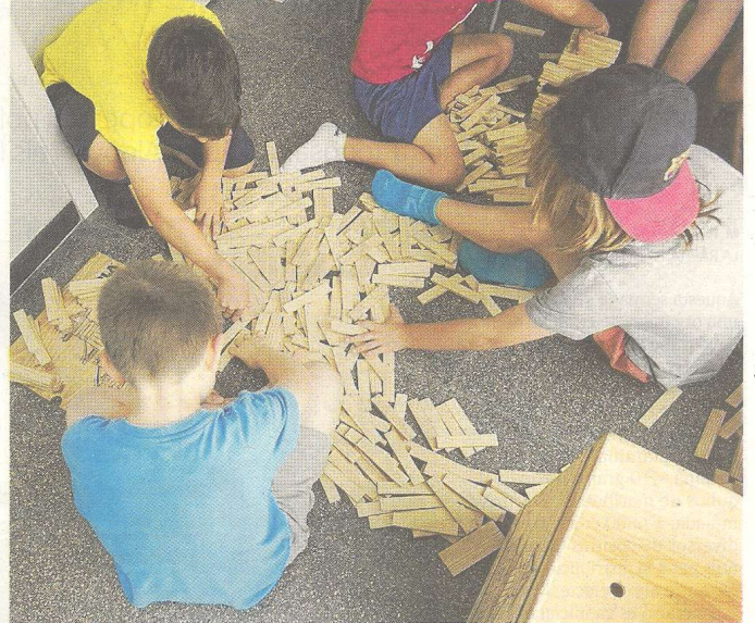
El joc és una part important de l'educació.