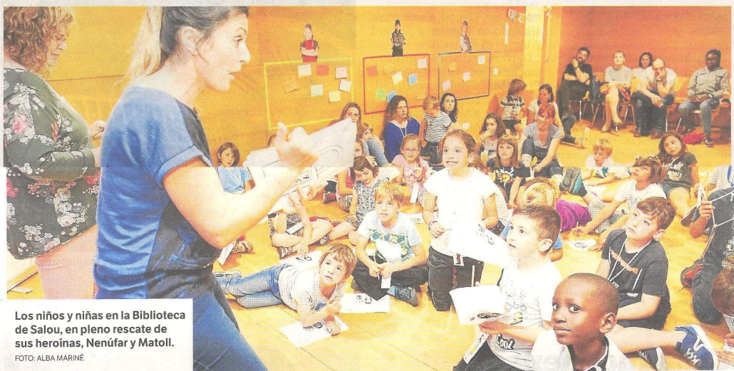
Los niños y niñas en la Biblioteca de Salou, en pleno rescate de sus heroínas, Nenúfar y Matoll.

Supernit a les biblioteques se enmarca entre los objetivos recogidos en el Pla de Lectura 2020.