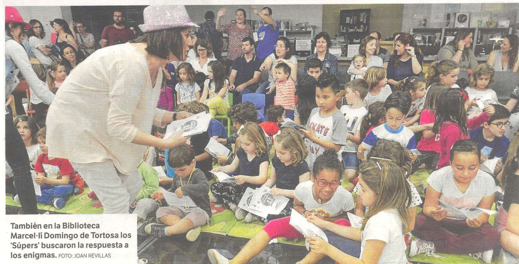
También en la Biblioteca Marcel·lí Domingo de Tortosa los 'Súpers' buscaron la respuesta a los enigmas.