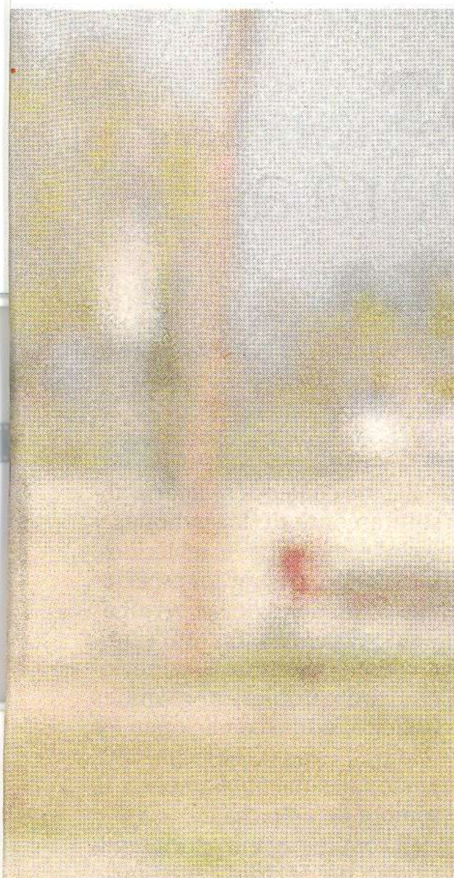
Maria Rodés, en un imagen del videoclip de 'Fui a buscar al sol' que rodó en el Delta de l'Ebre.

el que describe el horror de la guerra y cómo la observación del firmamento se convirtió en su refugio. Armonía cósmica vs caos terrenal», comenta.