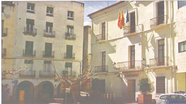
L'Ajuntament de Móra d'Ebre, en una imatge d'arxiu.

El Consell de Ministres del divendres 23 de març va aprovar un decret que prorroga per a aquest exercici del 2018 la possibilitat que les corporacions locals puguin destinar part del seu superàvit a realitzar "inversions financerament sostenibles". Des del 2014 aquestes corporacions locals sanejades en el seu pressupost i amb superàvit podien destinar una part del superàvit a realitzar inversions que financera-ment fossen sostenibles. El ministre d'Hisenda, Cristóbal Montoro, ha manifestat que la pròrroga ve acompanyada d'una ampliació dels serveis públics on es podran destinar aquestes inversions i que en ser reconegudes amb aquest qualificatiu no computen en la regla de despesa, per la qual cosa s'evita la generació de despeses no financeres futures que poden ser una font de déficit. Montoro ha destacat que el decret és un exemple de la capacitat de diàleg del govern perquè s'ha aprovat amb formacions polítiques "amb ideologies completament diferents". El decret llei aprovat pel Consell de Ministres es va pactar prèviament amb la Federació Es-