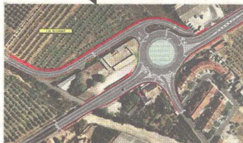
Glorieta de Alcanar. P.K. 1.062,5