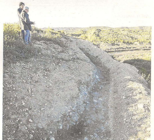
Imatge de la trinxera rehabilitada ubicada al costat del castell nou de Flix, aquesta setmana.

Les unitats de pontoners de l'Exèrcit de l'Ebre van excavar diversos refugis a la riba del riu per protegir-se dels bombardeigs diaris de l'aviació franquista durant la batalla de l'Ebre. Sovint, els pontoners reparaven de nit les destrosses produïdes durant el dia en les diverses infraestructures de pas (passarel·les, passos de barca, ponts permanents) i descansaven de dia. Eren coneguda l'existència de refugis d'aquesta mena a Flix i a Móra d'Ebre, ambdós en el seu marge dret. Ara, l'Ajuntament incorpora l'element i vol dotar-lo d'un protagonisme especial en els actes del 80è aniversari de la batalla de l'Ebre, que se celebra enguany.