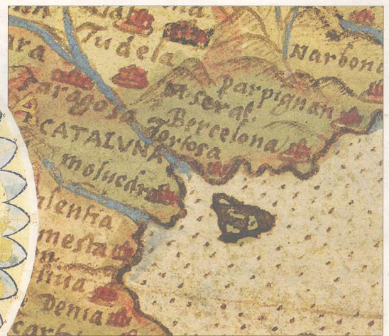
A l'esquerra, imatge del mapamundi dibuixat per Monte i, a la dreta, detall del mapa on surt Tortosa.

L'any 1587 el cartògraf italià Urbano Monte va pintar un extraordinari mapamundi de 3 metres per 3 metres. És, de fet, el mapa antic més gran que es conserva. Estava dividit en 60 làmines pensades per enganxar-se a una esfera gegant. S'hi pot apreciar, amb un gran luxe de detalls, el món conegut fins llavors i, a Catalunya, trobem escrits els noms de Perpinyà, Barcelona, Montserrat i... Tortosa. I és que en aquella època "Tortosa era la quinta ciutat més poblada de Catalunya" , tenia, per tant, "un pes demogràfic i comercial important" i, a