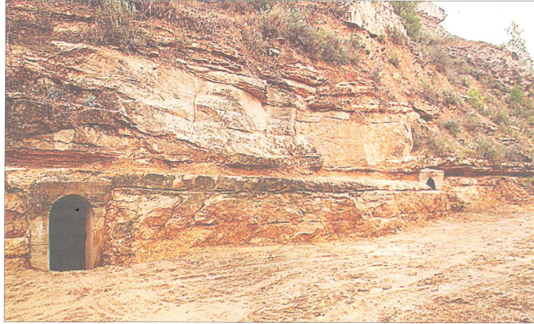
Vista de les dos entrades del refugi dels pontoners al turó del castell.

El refugi està excavat al turó del Castell de Flix i és fàcil accedir-hi per una de les rutes senderistes que voregen el meandre de la població per la part interior. El refugi consta de dos entrades, amb passadissos de deu metres que s'endinsen a la muntanya, units per una estana d'uns quinze metres.