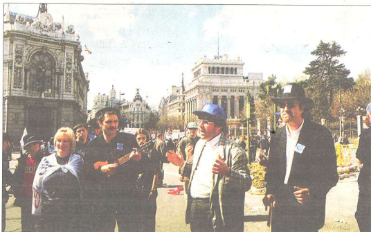
Els Quicos en una manifestació antitransvasament a Madrid, l'any 2001.

cos i han realitzat prop de 2.000 concerts arreu del país i també al País Valencià, les Balears, l'Aragó, el Rosselló o a ciutats com París, Madrid, Brussel·les, Bilbao o Saragossa. També han rebut molts premis com el Premi Nacional de Cultura 2015, el Joan Amades de Cultura Popular, el 2013, o 11 premis Enderrock. Actualment els Quicos estan inte-