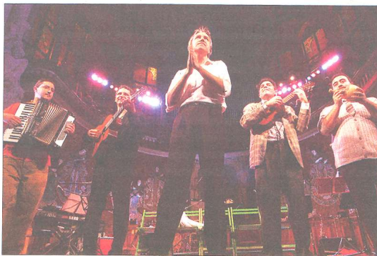
Actuació al Palau de la Música per celebrar el desè aniversari, el febrer del 2003.

Premi Nacional de Cultura 2015. Govern de la Generalitat de Catalunya.