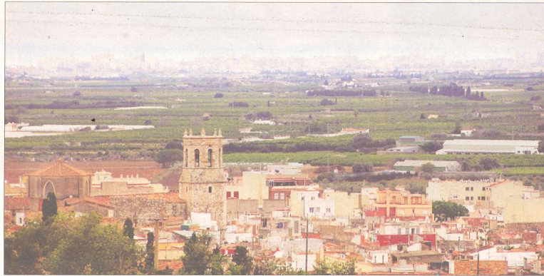
Imatge d'Alcanar, en primer pla, i al fons Vinaròs.

Les Terres de l'Ebre, des de sempre terra de cruïlla amb el País Valencià i l'Aragó, són, doncs, testimoni en primeríssima persona d'aquesta realitat. Per a molts dels seus habitants, aquestes fronteres, avui, no són res més que un límit administratiu, invisible als seus ulls i irrellevant per al seu dia a dia. La proximitat dels seus pobles ha provocat que les localitats frontereres ebrencs-igual que les de la resta de Catalunya- visquen estretament relacionades amb la comunitat autònoma que voregen. El País Valencià al sud, i l'Aragó a l'oest, s'endinsen en territori català establint uns mateixos valors socioculturals a banda i banda de frontera. Ara,