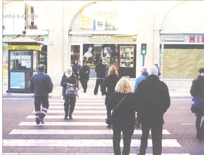
La població continua disminuint a l'Ebre. A la imatge, gent creuant l'Avinguda Generalitat a Tortosa.

Per edats, a Catalunya el 2016 la població va augmentar en els grups de 10 a 29 anys (+30.348 persones), de 40 a 74 anys (+65.354 persones) i en els majors de 80 anys (+11.341 persones), i va disminuir en la resta. El procés d'envelliment continua, com a resultat de la combinació d'una natalitat baixa i una esperança de vida alta, i des de l'any 1995 a Catalunya hi ha més població major de 65 anys que població menor de 15 anys. A 1 de gener del 2017 hi ha 117,5 persones majors