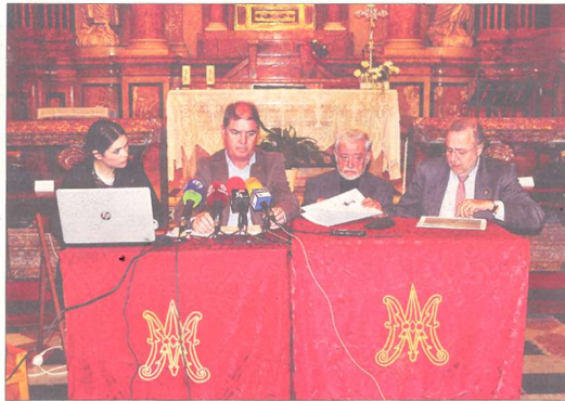
Moment de la roda de premsa, a la mateixa capella de la Cinta.

LOGOTIP I LEMA DE L'ANY JUBILAR Una imatge de la corona de la Mare de Déu de la Cinta ocupa l'espai central del logotip de l'Any Jubilar,