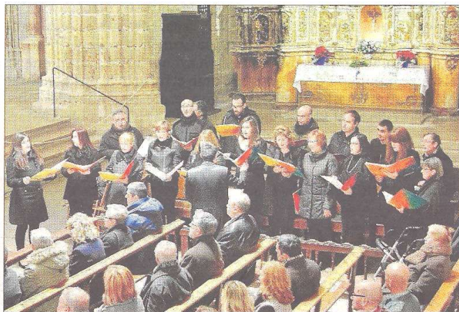
El cor de cambra Tyrichae va actuar al llarg de la missa solemne d'obertura de l'Any Jubilar.

Arxiconfraria de reliquiari menor de la Cinta perquè els fidels poguessin venerar-lo.