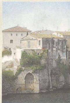
L'arc abans de les obres.

D'entre les restes històriques conservades, en destaquen les parts baixes de diferents torres i muralles que envoltaven tant la part del fossat com el cantó de l'Ebre. Per aquesta banda, el penyal rocós presenta diferents