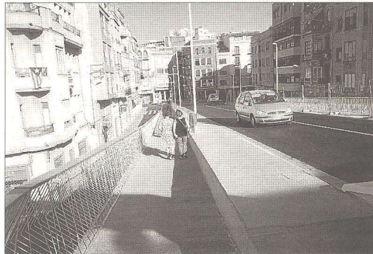
Imatge de la criticada rampa nord, ahir a la tarda.

viarà pel pont del Mil·lenari. La previsió és acabar la reforma del pont abans de les festes majors de la Cinta, a principis de setembre.