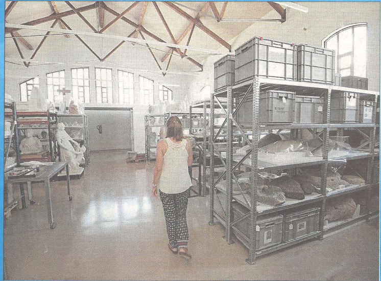
La sala de reserva, que custodia els objectes de la col·lecció que no es mostren al públic.

També unes peces molt característiques de l'exposició són els bustos de Demèter o una creu de terme, ja del segle XV, que s'usa-