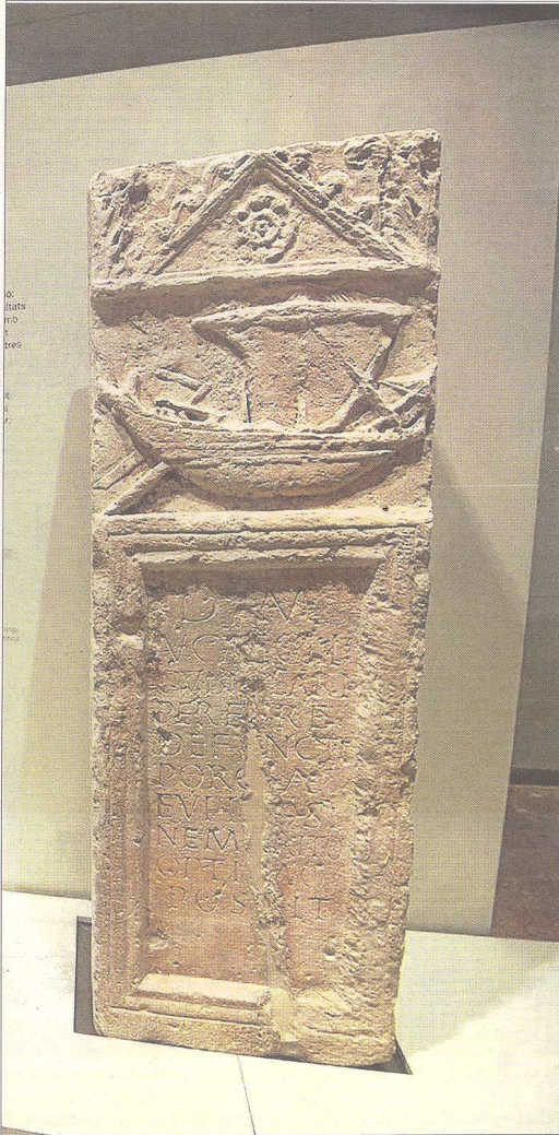
L'estela funerària, una de les peces més destacades.