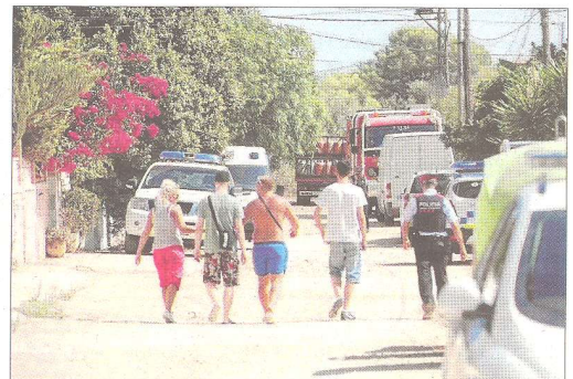
Vecinos de la urbanización Montecarlo de Alcanar Platja pudieron ayer regresar a sus viviendas.

■ Trasladado. El terrorista herido en la explosión fue llevado de Tortosa a la capital catalana.