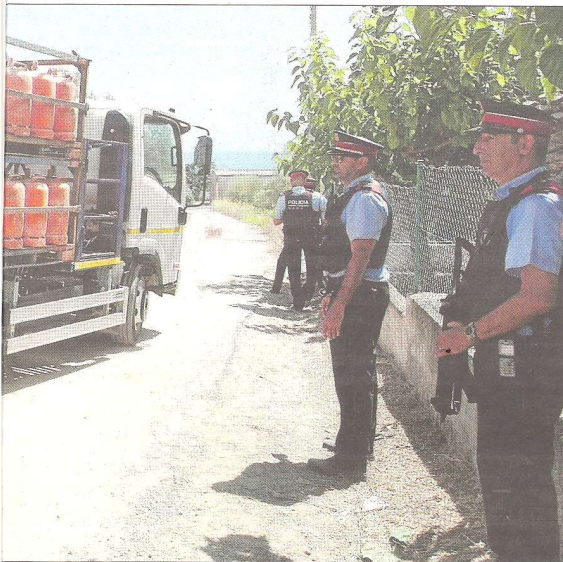
Montecarlo de Alcanar Platja.

El conseller de Interior, Joaquim Forn, ha destacado que Houli ha proporcionado en los interrogatorios policiales información relevante que ha permitido a los Mossos d'Esquadra avanzar en sus líneas de investigación. -A.C.