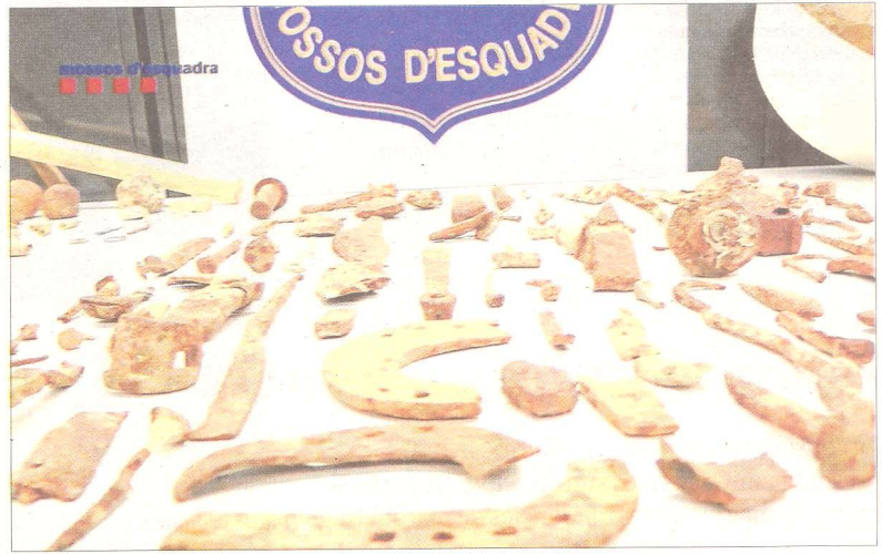
Imatge de les peces de ceràmica intervingudes al domicili del detingut.

El grup Terres de Cruïlla, format per centres d'estudis i entitats culturals i veïnals de l'Ebre, el Sènia i el Maestrat, ha manifes-