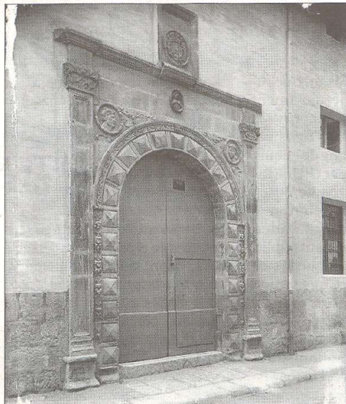
La porta cap al 1920.