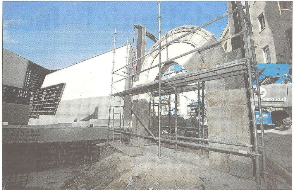
Imatge de la porta amb les bastides dels operaris per instal·lar-la, aquesta setmana.

Tot i que per a molts tortosins el nom de Joaquín Bau és freqüentment relacionat amb la seua vinculació amb el franquisme, el cert és que Bau va fundar el que seria el primer institut no religiós a Tortosa.