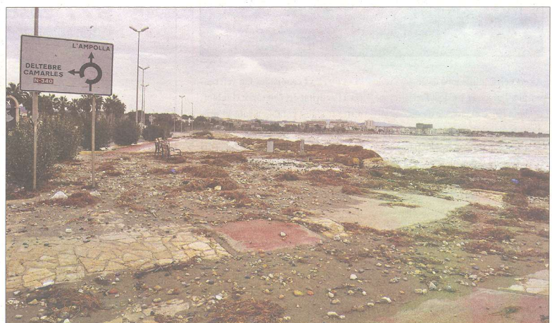
Les roques i les algues van envair la platja de l'Arenal, a l'Ampolla. / NÚRIA CARO