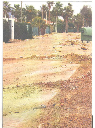
Imatges de la costa del municipi d'Alcanar, on e