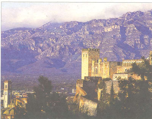
La posició estratègica de Turtuixa permetia controlar dos elements clau en una època de pugnes constants: el riu Ebre i el Port i la seua vall. / F.M.

L'ocupació va seguir un model similar a cadascun dels punts d'Hispania: desfeta estatal i dos o tres victòries militars, seguides de submissió pactada entre les ciutats i els exèrcits musulmans. En aquest sentit, Jordi Marquès, llicenciat en Història, apunta que "no s'ha d'entendre com una conquesta violenta, ben al contrari" . A aquesta realitat va ajudar a l'acceptació de la població que, lluny d'entendre-ho com un fet traumàtic, va facilitar una ràpida assimilació cultural i social. Miravall ho resumia així en la seua obra: "La massa popular va veure la possibilitat d'escapar del domini senyorial i, donada la seua situació deplorable, no calia esperar el mínim esforç per deturar l'avançament islàmic puix que no tenien raons socials ni religioses per fer-ho i en el canvi polític no hi tenien res a perdre, ben al contrari". També és cert que les tropes musulmanes van ser respectuoses amb la forma de vida de la societat autòctona i aquesta relativa tolerància d'ambdós parts va agilitzar un procés que hagués pogut esdevenir molt