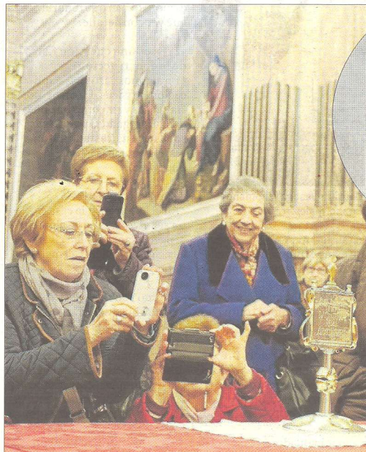
Presentació del nou reliquiari, a la capella de la Cinta de la catedral, ahir al matí.