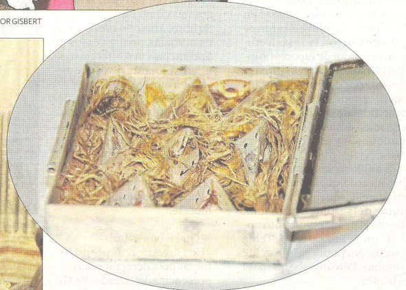
Detall del contingut del Reliquiari Menor, on hi ha el fragment conservat de la Cinta.

Per contra, el Reliquiari Menor sí que va poder ser localitzat a Darnius (Alt Empordà) també camí de l'exili, i va ser retornar a la catedral de Tortosa.