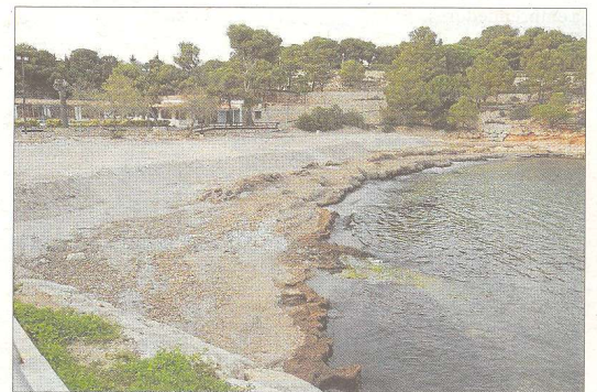
Reposició de sorra a la platja de Pixavaques, al terme de l'Ametlla de Mar.

Queda encara pendent la reposició a les platges de l'Alguer i Cala Vidre, també a l'Ametlla, així com a l'Arenal de l'Ampolla. En aquest cas, segons detallen des de Costes, es preveu que la sorra reposada procedeixi del port de Sant Jordi de l'Ametlla, on, per contra, s'acumula cada any de forma molt important. Així, s'intentaran coordinar al màxim els treballs d'extracció a Sant Jordi i reposició a l'Arenal.