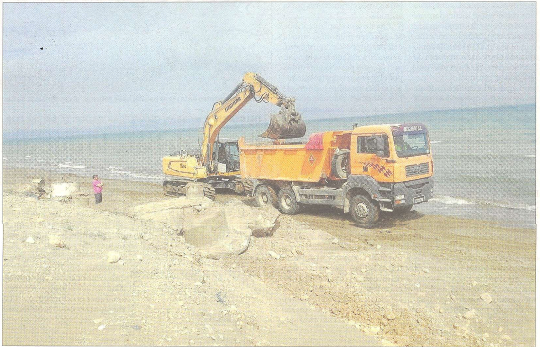
Màquines i operaris treballant a la zona litoral de Nen Perdut, a Deltebre.

Ja estan en marxa les obres a la zona del Nen Perdut de Delte-