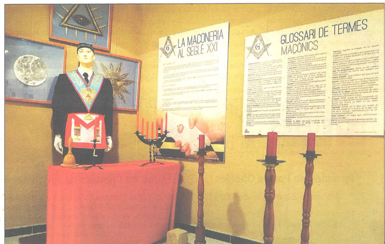
Imatge d'un temple maçònic, corresponent a la lògia Gallard de Josà, i (a sota) una imatge d'alguns dels elements de l'exposició que es va poder visitar a Móra d'Ebre.

terme una certa conspiració política", assenyala el catedràtic de Flix. L'absolutisme de Ferran VII, entre d'altres, en va ser víctima.