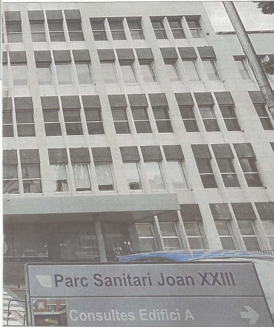
7,8 sobre 10.

■ El Sistema de Emergencias Médicas (SEM) llevó a cabo el año pasado 1.474.610 servicios. Se registraron 129 reclamaciones, que representaron el 0,02% del total de activaciones por «disconformidades» con el servicio, según explicó recientemente el director, Joan Sala.