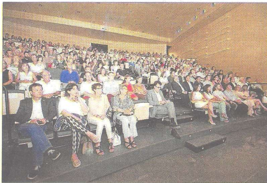
Els assistents a la inauguració, ahir.

cadirat retràtil per tal de poder disposar d'una sala més versàtil, augmentant així les possibilitats de l'equipament.