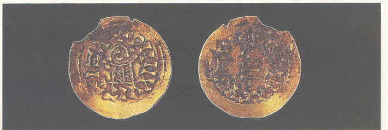
Dos trients d'or del regnat de Witiza (698-710 d.C.), / CEDIDA