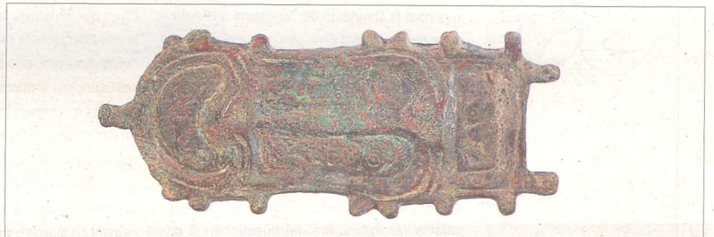
Sivella de cinturó visigòtica, obrada en bronze i profusament decorada. Segles VI-VII.