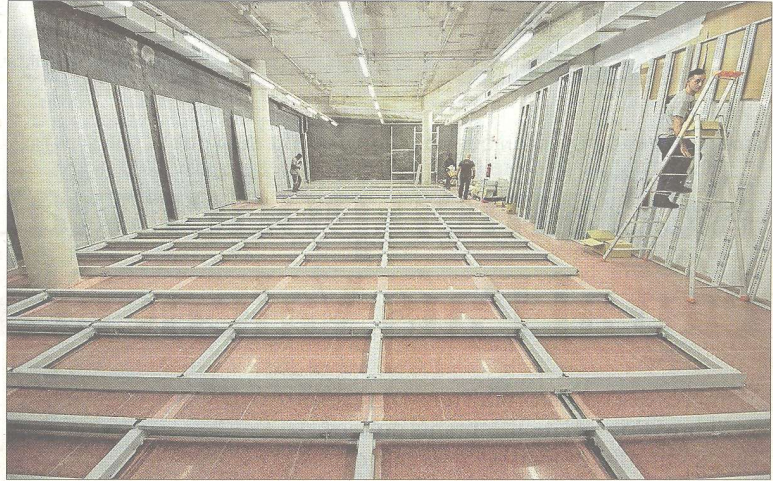
Operaris acabant de construir l'arxiu de l'edifici.

Aquesta modificació també va comportar un estalvi del pressupost inicial, que era de 12.611.313 euros als 10.474.573 euros del pressupost actual; als quals cal sumar els 4,4 milions més del pàrquing soterrat. Així, el total